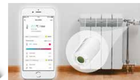
LABO magasinet · nr. 4 2019