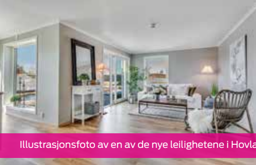
Illustrasjonsfoto av en av de nye leilighetene i Hovland Park.